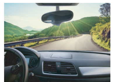
▲偏光レンズ装着時 視界がクリアに! ※画像はイメージです。

レンズの中の偏光フィルムが反射光をカットし、視界をクリアにします。(フロントガラスへの映り込みや、海や川での水面の反射光がカットされます。)