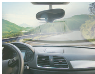
▲未装着時 反射光によりフロントガラス に映り込みが見える。