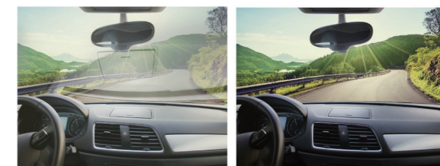
未装着時 (反射光によりフロントガラスに映り込みが見える) 偏光レンズ装着時

レンズの中の偏光フィルムが反射光をカットし、視界をクリアにします。まぶしさも軽減される為、眼への負担を和らげます。(フロントガラスへの映り込みや、海や川での水面の反射光がカットされます。)