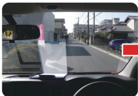
ポラフィット装着前