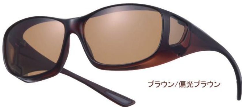
ブラウン/偏光ブラウン