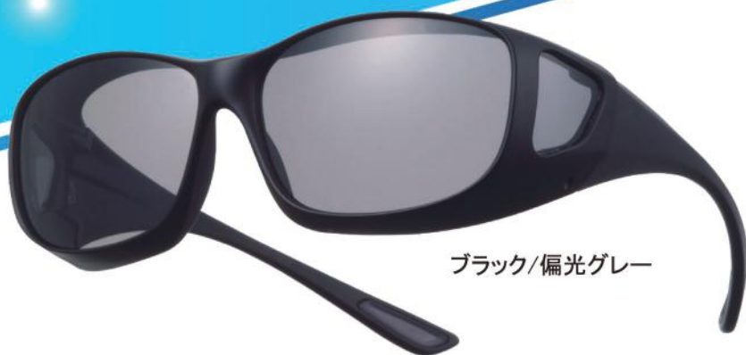
ブラック/偏光グレー