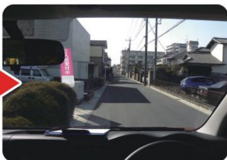
ポラフィット装着後