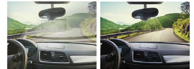
未装着時 (反射光によりフロントガラスに映り込みが見える) 偏光レンズ装着時

レンズの中の偏光フィルムが反射光をカットし、視界をクリアにします。まぶしさも軽減される為、眼への負担を和らげます。(フロントガラスへの映り込みや、海や川での水面の反射光がカットされます。)